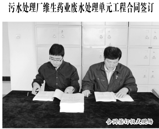
合同签订仪式现场

4月28日上午,在污水厂综合楼,公司与北京格兰特膜分离设备有限公司代表就污水厂深度处理项目,维生药业废水处理单元工程签订了合同协议书。合同的签订标志着日处理2万吨的制药废水处理单元项目施工就此展开。本工程预计今年9月通水,年底前完成工艺试运行一级A达标排放。