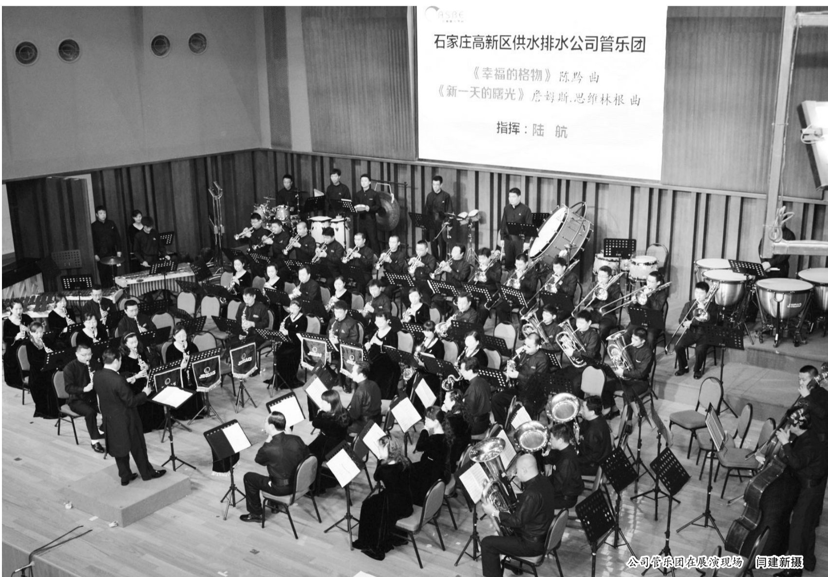
公司管乐团在展演现场

本报讯(王卿) 5月2日下午,“中华杯”中国第八届非职业优秀(交响)管乐团展演在上海音乐学院实验学校音乐厅落下帷幕,公司管乐团以高难度的技艺与团结协作的精神,感染了评委及现场观众,夺得了中国第八届非职业优秀(交响)管乐团展演社会组金奖,这也是继去年中国第七届非职业优秀(行进)管乐团展演以来第二次获此殊荣。同时,管乐团还被授予“中国金钟之星管乐团”称号,该奖项是中国非职业优秀管乐团的最高荣誉。为表彰公司管乐团多年来对中国管乐发展做出的努力,管乐团还被授予“中国管乐发